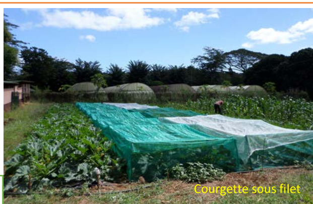
Courgette sous filet