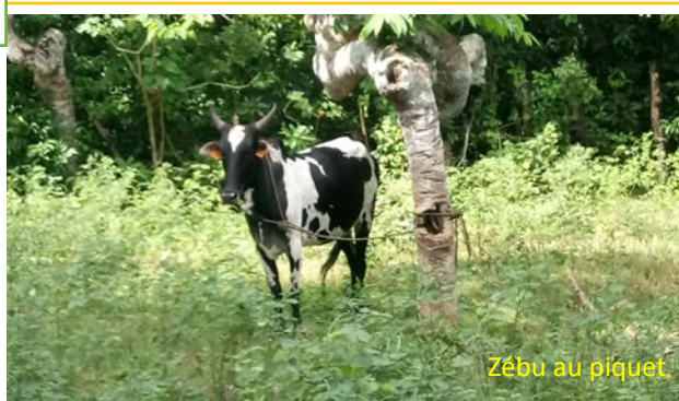
Zébu au piquet