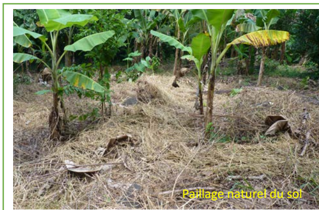
Paillage naturel du sol