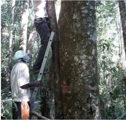
Mesure du diamètre d'un arbre en vue de l'évaluation des stocks de carbone d'une forêt tropicale humide du massif du Tsaratanana (Madagascar).

(-107 mm) pourraient conduire à une diminution de 17 % (certaines prédictions allant jusqu'à - 24 %) du stock de carbone forestier d'ici à 2080. En forêt, les arbres et les espèces de plus petite taille seraient favorisés et sélectionnés sous l'effet du climat. L'étude identifie également des points de basculement : au-dessus d'une température moyenne annuelle de 21 °C et en dessous de 1 100 mm de précipitations par an, le stock de carbone des forêts tropicales humides pourrait s'effondrer.