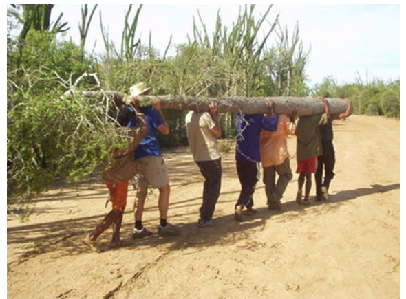
Transport d'un arbre en forêt sèche épineuse (Madagascar) en vue de sa pesée pour l'estimation de sa biomasse.

Enfin, des phénomènes de mortalité en masse des arbres sont actuellement observés à divers endroits du globe. Cette mortalité peut être associée soit à des épisodes de sécheresse conduisant à des phénomènes de cavitation (embolie gazeuse empêchant la sève de circuler dans l'arbre) ou à des attaques d'insectes ravageurs dont les populations explosent sous l'effet de l'augmentation des températures (voir à ce propos le cas du bostryche typographe qui menace les peuplements d'épicéa dans les forêts de montagne de moyenne altitude en France).