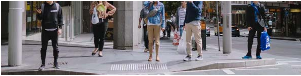
Les comportements des populations influent sur le devenir des épidémies.