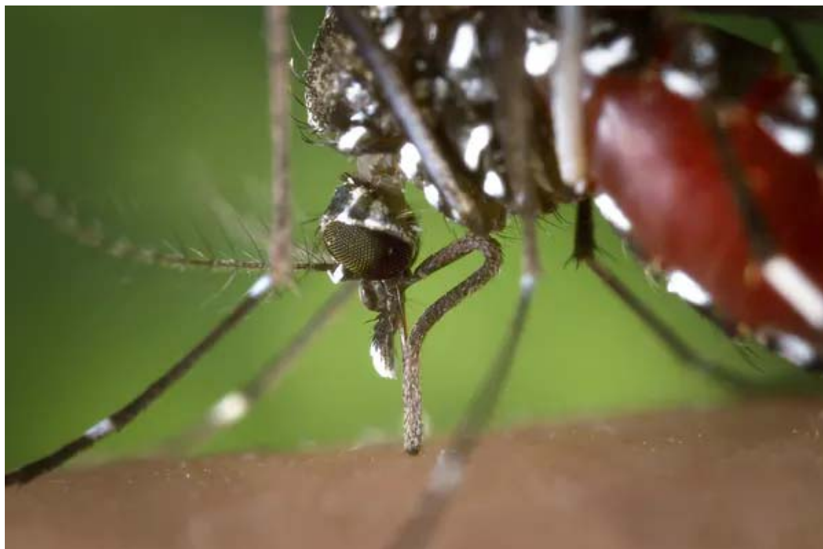
Aedes albopictus , le moustique tigre vecteur de diverses maladies, est parti à la conquête de la planète.