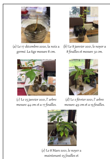
Fig.3 : Informations retranscrites dans le cahier d'expérimentation des élèves lors des essais de plantations.

À la faveur de l'expérimentation que la classe a menée, les élèves ont pu, tout au long de l'année scolaire, observer les noyers pousser grâce à la terre, la lumière, l'eau et l'air. Ils ont ainsi observé et retracé, par des mesures et des photographies, l'évolution de la croissance de leurs arbres (Figure 3).