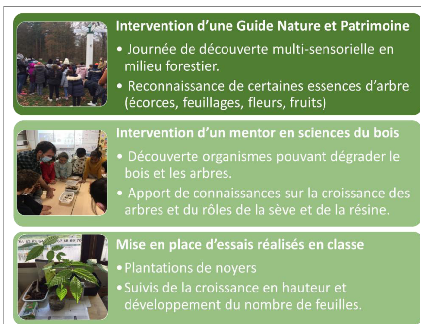
Fig. 1 : Etapes de la démarche scientifique adoptée par les élèves et enseignants au cours du projet, réalisées en étroite collaboration avec un chercheur et une guide nature & patrimoine.

La figure 1 schématise les différentes étapes de la démarche scientifique adoptée par les élèves et les enseignants, ainsi que les intervenants extérieurs à la classe (chercheur et guide) qui les ont accompagnés dans leur démarche en quête de savoirs.