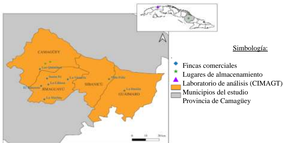
Figura 1. Ubicaciones de las ocho fincas comerciales implicadas en el estudio, los lugares de almacenamiento y conservación de las muestras y el laboratorio de análisis bioquímico. Las localizaciones fueron adquiridas por GPS y cartografiadas con el programa QGIS 3.34.2 ( www.qgis.org ). En azul las ocho fincas comerciales estudiadas, en verde los dos lugares de almacenamiento de las muestras antes de su análisis en el laboratorio del CIMAGT (en violeta). Origen del Shapefile: https://data.humdata.org/dataset/ . Sistema de coordenadas de referencia: EPSG:4326 - WGS 84.

A los individuos seleccionados se les diseñó un monitoreo longitudinal (dos años; 2024-2026) con muestreos programados cada mes y medio aproximadamente, buscando representatividad de los estados fisiológicos de la hembra (fase de monta, inicio, mediados y final de la gestación y/o de la lactación, periodo seco, etc.) y de las épocas del año (lluviosa y seca) (Figura 3).