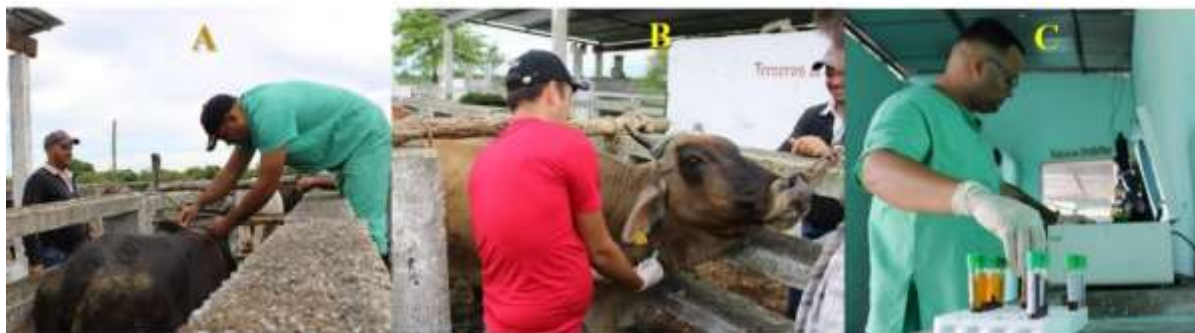
Figura 4. Ilustración del proceso de muestreo de los animales monitoreados. A: Medida del perímetro torácico. B: Extracción de sangre de la vena yugular. C: Centrifugación de la sangre por la extracción del plasma.