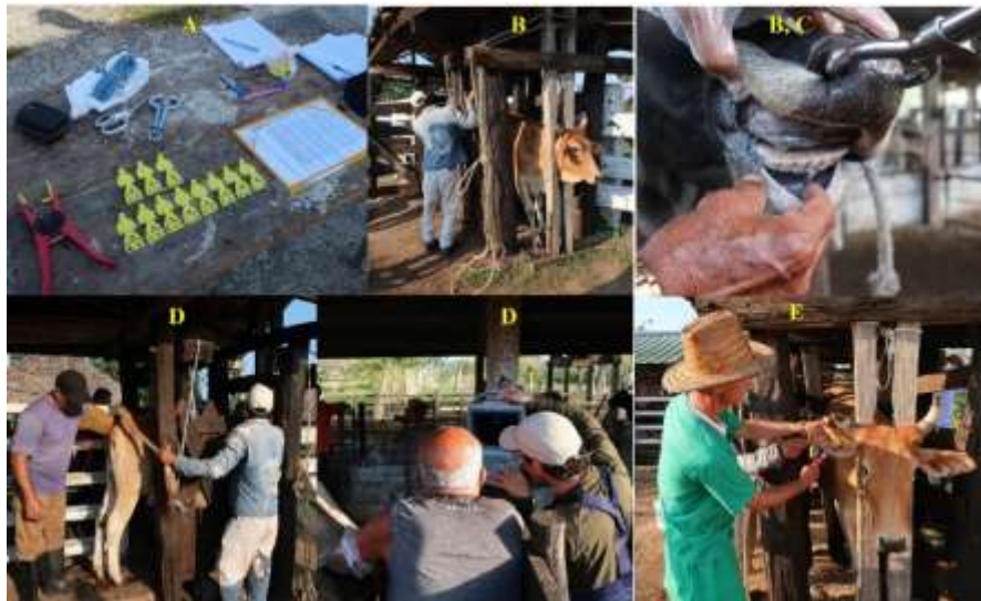
Figura 2. Ilustraciones del proceso de co-selección de los animales a emplear en el estudio. A: Material utilizado. B: Sistema de contención de los animales (guillotina o mosca). C: Determinación de la edad en función del estado de los dientes. D: Palpación y ecografía de los animales. E: Identificación individual (aretes o crotales).